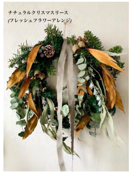
ナチュラルクリスマスリース (フレッシュフラワーアレンジ)

■講師 花のアトリエ KAKAN フラワー1級装飾技能士 ■申込み方法 ご希望の講座名と氏名、郵便番号、住所、電話番号、メールアドレスをご記入の上、一般財団法人大阪市教育会館まで FAX・Eメール・郵送にてお申込み下さい。 ※応募締切り：各回10日前まで。 ■お申込み 一般財団法人大阪市教育会館 〒540-0006 大阪市中央区法円坂1-1-35 TEL06-6941-0951 FAX 06-6941-7474 Mail kaikan@zaidan.or.jp