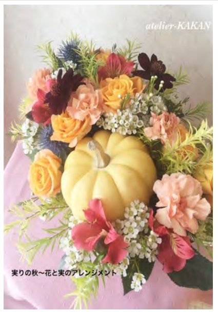
実りの秋〜花と実のアレンジメント