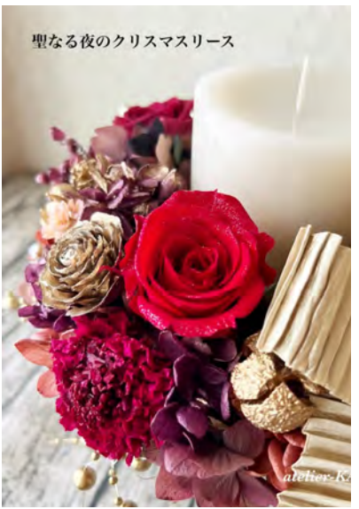
聖なる夜のクリスマスリース