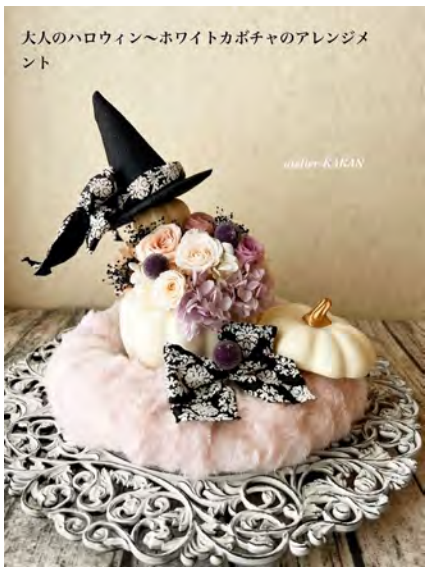
大人のハロウィン〜ホワイトカボチャのアレンジメント